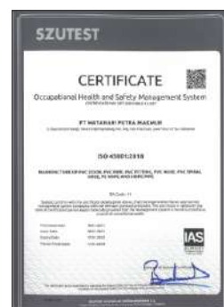
Sertifikat ISO 45001:2018 (OHSAS)