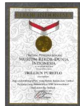
Sertifikat MURI Pipa & Fitting Trilliumpureflo