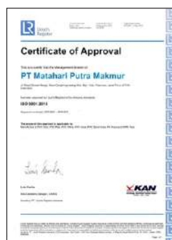
Sertifikat ISO 9001:2015