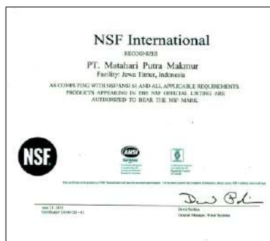
Sertifikat NSF Pipa & Fitting Trilliumpureflo