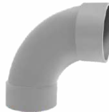
Large Radius Elbow