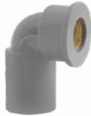
Faucet Elbow (Metal Insert)